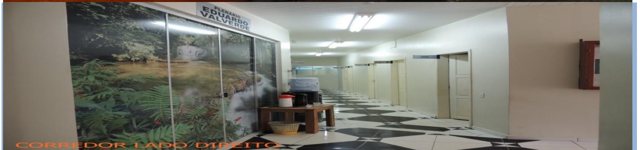
CORREDOR LADO DIREITO